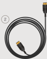
HDMI 2.0-kabel / HDMI 2.0 cable