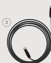
Nettverkskabel / Ethernet cable